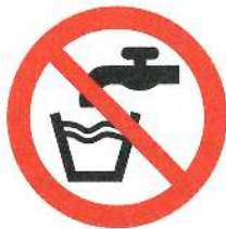
Abbildung 2: Zeichen für „Kein Trinkwasser“

Nichttrinkwasserleitungen sind nach der Trinkwasserverordnung und nach DIN 2403 eindeutig und dauerhaft farblich unterschiedlich zu kennzeichnen, damit es zu keiner Verwechslung kommt. Alle Entnahmestellen der RWNA sind mit einem Schild „Kein Trinkwasser“ oder dem Bild (Abb.2) zu kennzeichnen.